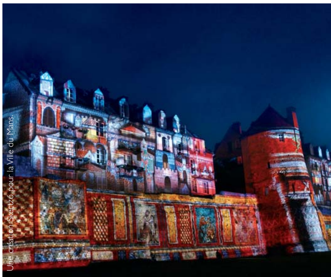
Une création Skerzô pour la Ville du Mans.

ROOMS : 39 FROM : 93/233 € BREAK. : 14 € MENU : 30 € CONF. : 300 pers. CAP. : 300 pers.